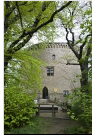
Zwinger Goslar Eingang Ferienwohnungen

Goslar/Harz 1000 jährige Kaiserstadt mit rd. 44.000 Einwohner. Die Goslarer Altstadt und das Bergbaumuseum Rammelsberg gehören zum Weltkulturerbe der UNESCO. Die Stadt Goslar hat zahlreiche Sehenswürdigkeiten und bietet auch für den Naturliebhaber und für Sportler in unmittelbarer Nähe reichlich Angebote.