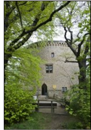
Zwinger Goslar Eingang Ferienwohnungen

Goslar/Harz 1000 jährige Kaiserstadt mit rd. 44.000 Einwohner. Die Goslarer Altstadt und das Bergbaumuseum Rammelsberg gehören zum Weltkulturerbe der UNESCO. Die Stadt Goslar hat zahlreiche Sehenswürdigkeiten und bietet auch für den Naturliebhaber und für Sportler in unmittelbarer Nähe reichlich Angebote.