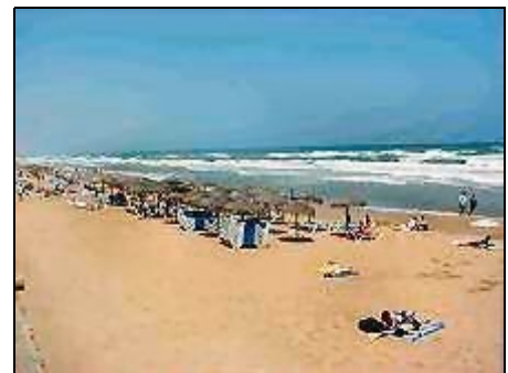
Sandstrand soweit das Auge reicht

Die Ferienwohnung liegt etwa 3 Km nördlich des Zentrums von Torrevieja. Zum schönen kilometerlangen Sandstrand sind es 800 m (10 Min. Fußweg). Gute Einkaufsmöglichkeiten in unmittelbarer Nähe der Wohnung. Mediterranes Heilklima, Salzseen, bergiges Hinterland mit vielen Orangen- u. Zitrusplantagen prägen die Landschaft. In näherer Umgebung laden Orte wie Alicante, Elche und Murcia genau wie Torrevieja selbst mit ihren vielen Sehenswürdigkeiten und hervorragenden Lokalen zum Stadtbummel ein.