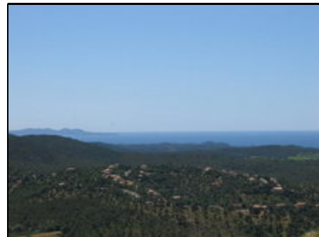
Blick auf Mittelmeer und Maurengebirge

Bootsfahrten zu den Inseln Porquerolles, Port-Cros und Ile du Levant. Besichtigung von Toulon, Hyères, St. Tropez, Le Lavandou, Bormes-les-Mimosas, Nizza und Cannes Entdeckungsfahrten ins Hinterland der Côte d'Azur.