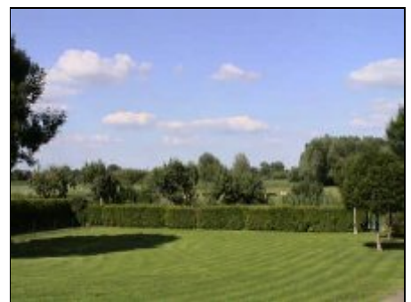
Vorgarten / Liegewiese

Die Elbinsel Krautsand liegt zwischen Hamburg und der Nordsee. Wer hierher kommt sollte Naturfreund sein und die ländliche Ruhe und Abgeschiedenheit lieben. Genießen Sie bei Radtouren und Spaziergängen durch Wiesen und Felder, auf dem Deich oder am Strand die frische Land- und Seeluft. Lassen Sie einfach nur die Seele baumeln. Für Ausflüge bieten sich an: Stade mit seiner wunderschönen Altstadt, Hamburg, z.B. für ein Musical, Bremen mit dem neuen Space-Center, eine kleine Seefahrt nach Helgoland