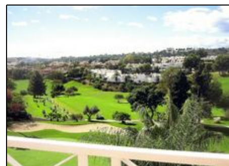
Ansicht der schönen Ferienanlage

Ausführliche Informationen über Marbella und die Umgebung finden die auf unserer Homepage, zu finden am Ende dieser Seite unter "Kontakt"