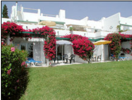
Terrasse mit Sitzgruppe und Gartenliegen

Komf. Ferienwohnung in einer ruhigen, exklusiven Wohnanlage, herrliche Poolanlage, zentral gelegen mit traumhaftem Panoramablick auf Berge und Meer.