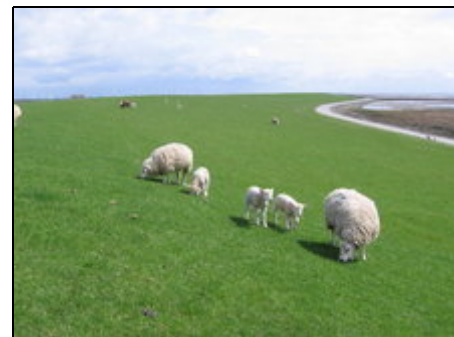
Schafe am Deich

Apartment in Neukirchen, ein Ort mit ca. 1000 Einwohnern. Einkaufsmöglichkeiten, Restaurants im Ort vorhanden. Der nächste Hafen an der Nordsee ist Dagebüll, das Sprungbrett zu den Halligen Föhr und Amrum. Natur pur. Nahe der dänischen Grenze, der Insel Sylt und der Insel Römö (DK) mit dem riesigen (befahrbaren) Sandstrand. Nur 15 Minuten bis Tondern (DK). Nolde Museum ca. 4km entfernt, Badesee ganz in der Nähe und beheiztes Schwimmbad im Ort. Unsere Kreisstadt ist Husum.