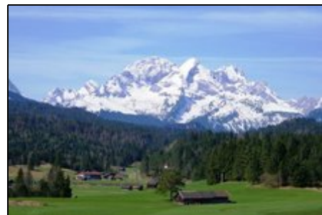
Umgebung um Mittenwald

Sie haben ideale Ausflugsmöglichkeiten zu den Königsschlössern, ins nahe Karwendelgebirge oder n