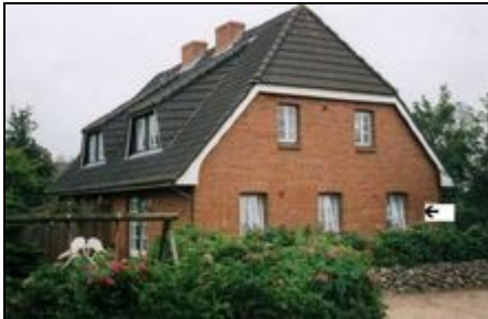
Unsere Ferienwohnung unten Süd

Ferienwohnung auf der Nordsee Insel Föhr. Die Ferienwohnung liegt in einer ruhigen Seitenstraße in Wrixum. Wyk erreichen Sie zu Fuß in ca. 20 Minuten.