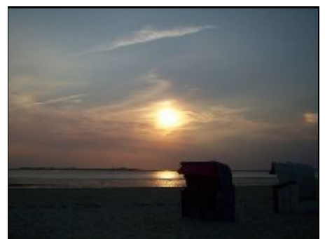
Abend am Strand

Im Dorf befinden sich drei Reitställe. Die Insel bietet ca. 145 km Radweg, 3 historische Kirchen, 5 Windmühlen, 200 ha Wald, sowie 15 km Sandstrand, surfen u. segeln. Museumseröffnung (Kunst der Westküste) am 01. Juli 2009. Entfernung: 200 m Museumsgastronomie mit Rosengarten schon eröffnet! Wattwanderungen zur Nachbarinsel Amrum oder auf den Halligen. Wellenhallenbad, Golfplatz.