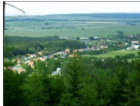
Blick vom Kienberg auf Crawinkel

Crawinkel, am Fuße des Thüringer Waldes gelegen, ist idealer Ausgangspunkt für Tagestouren zu den interessantesten Städten Thüringens: Weimar, Erfurt, Gotha, Eisenach, 9 km bis Oberhof - Wandertouren auf dem Rennsteig, Mountainbiken im Thüringer Wald, Jonastal, Crawinkel selbst bietet ideale Bedingungen für Gleitschirmflieger, Angelmöglichkeiten 1000 m vom Haus entfernt, Ausflüge zu den benachbarten Talsperren sind zu Fuß und mit dem Fahrrad ein Erlebnis.