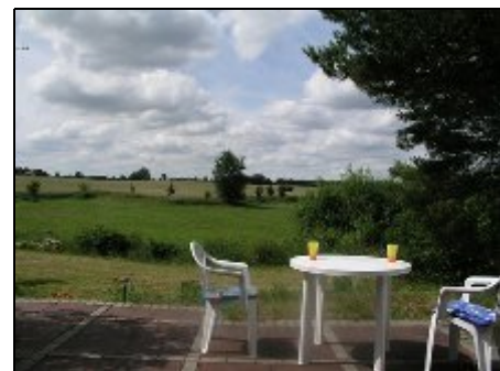
Blick über die hügelige Landschaft

Wildbeobachtungen sind täglich möglich. Ein Angelteich ist nahe. Einen Badesee erreicht man bequem zu Fuß. Es bieten sich auch Ausflugs- und Einkaufsfahrten nach Stettin oder zum Tierpark in Ueckermünde, den Museen in Pasewalk, der Burgruine und der Tausendjährigen Eiche in Löcknitz, dem Slawendorf "Ukranenland" bei Torgelow an. Die Wildtierstiftung in Klepelshagen ist ein Besuch wert. Skatern und Radfahrern empfohlen. Nur 100 m bis zum privaten Grenzübergang am Grenzstein 833.