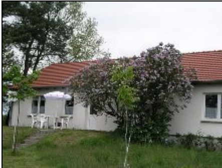
Ferienwohnung mit Terrasse

Ferienwohnung Lühn. Blankensee - Vorpommern, direkt an der polnischen Grenze - Alleinlage am "Naturpark Stettiner Haff" 53°31'03 N 14°19'05 E