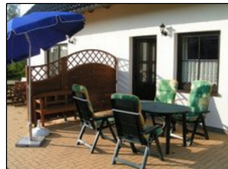
Ein Blick auf die Terrasse

2000 m in westlicher Richtung befindet sich das Ostseebad Kühlungsborn. Neben dem Yachthafen bietet der Ort viele Veranstaltungen für jeden Geschmack sowie unzählige Bars und Restaurants. 3000 m in östlicher Richtung liegt das Ostseebad Heiligendamm mit der ältesten Pferderennbahn. Sie können die Ostseebäder bequem mit dem Drahtesel, dem Auto oder mit der über 100 Jahre alten Dampfisenbahn Molli entdecken. In südlicher Richtung befindet sich ein Golfplatz und der bewaldete Höhenzug Kühlung.