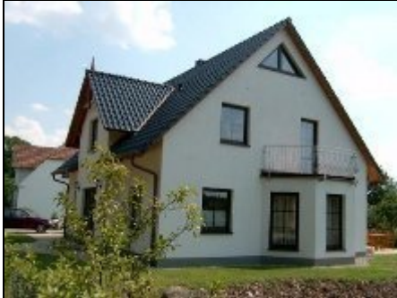
Eine Ansicht vom Haus