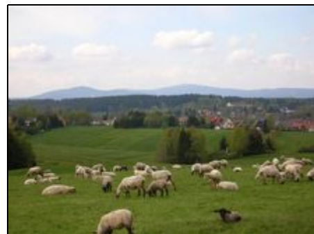
Wanderpause mit Blick auf Benneckenstein

Ausflüge in die Fachwerkstädte Wernigerode, Goslar, Quedlinburg oder zu den vielen anderen Sehenswürdigkeiten sind ebenso interessant wie eine Brockenfahrt mit der historischen Harzquerbahn.