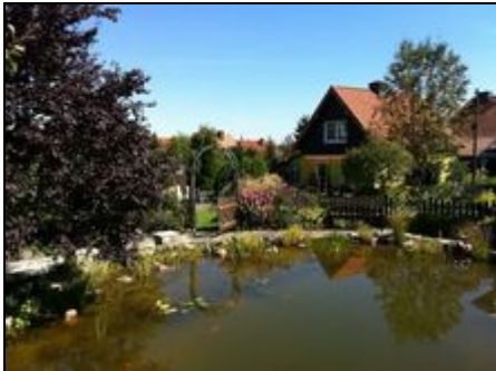
Blick über den Teich zum Ferienhaus

2 separate Ferienwohnungen für je 2 Personen in ruhiger Lage mit großem Garten. Eine Wohnung zusätzlich mit Kaminofen für romantische Stunden!