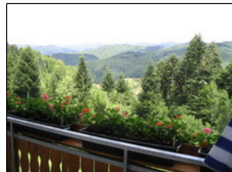
Blick vom Balkon, Ferienwohnung 2

Unsere Ferienwohnungen liegen umgeben von Wald und Wiesen ca. 5 km von der Stadt Oppenau im Ortsteil Ibach. Wir bieten ruhige Lage (kein Durchgangsverkehr) mit schönem Ausblick. Viele Wander- und Ausflugsmöglichkeiten z.B. Klosterruine Allerheiligen mit Wasserfällen, Europapark Rust, Straßburg, Freudenstadt, Baden-Baden, Mummelsee, Vogtsbauernhöfe, Bodensee, Riesenrutsche, Skilifte und Loipen in ca. 25 min. erreichbar.