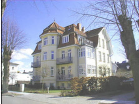
Dünenstr. 2, Hausansicht

Die Ferienwohnung ist komfortabel, individuell und wohnlich ausgestattet, zentral gelegen, Einkaufsmöglichkeiten vorhanden, 300m z. persönl.Strandkorb