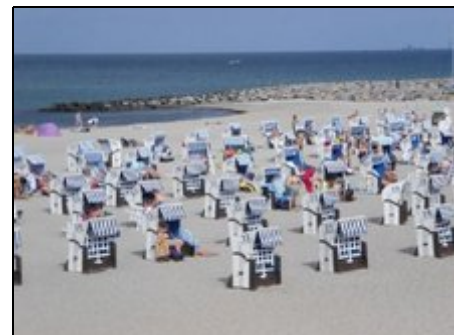
Hier wartet Ihr Strandkorb auf Sie

Die Ferienwohnung liegt in einer kurzen Nebenstraße zwischen Lindenpark (Tennisplätze) und Strandstraße zur Seebrücke. Der Ostseestrand ist außerdem in 5 Min. über einen bewaldeten Fußweg zu erreichen. Seit Jan. 2010 gibt es ein Hallenbad mit einem 25x12,5m-Becken u. 29° Wassertemperatur (ca. 400 m). Zu ausgedehnten Radtouren und Wanderungen ist Kühlungsborn selbst (Stadtwald, Strandwege) sowie die Umgebung von Kühlungsborn bestens geeignet. Der Höhenzug "Kühlung" lädt ebenso dazu ein.