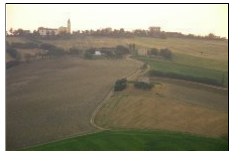
Blick -Landschaft der Marken

Casa Spicello liegt zwischen der Gemeinde San Giorgio di Pesaro und San Constanzo. Vom Balkon der Wohnung haben Sie einen herrlichen Ausblick zum Meer daß in 10 km Luftlinie entfernt ist. Fano 12 km entfernt mit seinen Fischereihafen und Märkten laden zum Besuch ein. Die Badeorte Torette, Marotta und Senigalia mit herrlichen Sand oder Kiesselstrand sind zum Erholen bestens geeignet. Die Berge des Appennins sind ca 25 km entfernt.