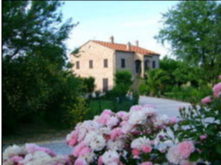
Einfahrt zur Casa Collina

Großzügige und komfortable Ferienwohnung, eigener Eingang, Terrasse, im allein gelegenen, ehemaligen Bauernhaus, 1km zum Ort, 10km zum Meer