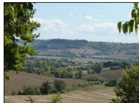
Blick auf Monte Porzio vom Grundstück

Um unser Haus herum können Sie auf ruhigen Straßen mit Blick auf das Meer oder die Berge ausgedehnte Spaziergänge machen. In der weiteren Umgebung finden Sie interessante Ausflugsziele, die es lohnt kennen zu lernen: Die mittelalterlichen Städtchen Mondavio, Corinaldo, größere Städte wie Fano und Urbino, die Perle der nördlichen Marken, Ancona mit dem Monte Conero, die Furlo-Schlucht, die Tropfsteinhöhlen von Frasassi und für Wanderfreunde die Berge des Apennin z.B. der Monte Catria.