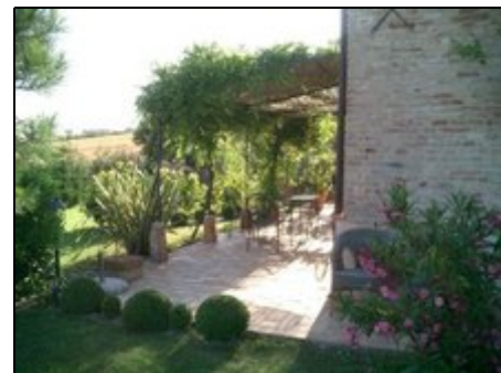
Ihre uneinsehbare, private Terrasse...

Die Nähe zum Meer (15km) das sanfte hügelige Hinterland, bishin zum Apennin, gewähren Ihnen nicht nur kulturelle sondern auch kulinarische Leckerbissen. Urbino, Geburtsstadt Raffaels, San Marino, San Leo, die mittelalterliche Städte am Meer, wie Pesaro, Fano oder Senigallia, oder der südl. von Ancona gelegene Naturschutzpark mit seiner Steilküste, sind schnell erreicht. ... erlebnisreiche und erholsame Ferien garantiert.