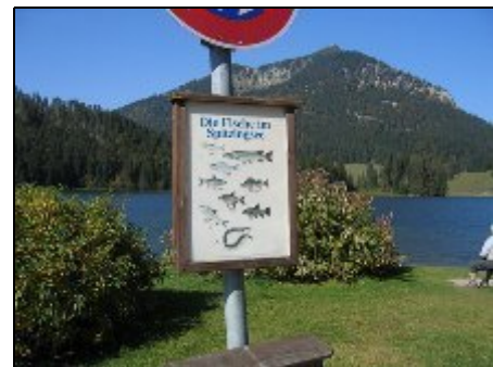
Am nahen Spitzingsee

Im Sommer kann man im nahen Schliersee schwimmen. Im Winter bietet sich jeglicher Wintersport an. Schliersee ist international bekannter Kur- u. Urlaubsort in den bayerischen Alpen. Der See, die Berge, die nähere Umgebung mit 3 Bergbahnen, lassen das ganze Jahr, den Urlaub zum Erlebnis werden. Wandern auf Almen mit zünftiger Brotzeit, autofreier ebener Uferweg am See, Bergbauernmuseum von Skiass Markus Wasmeier, Bauerntheater in Schliersee, Ausflüge nach München, und Oberland.