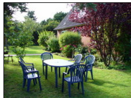
Garten des Hauses und der Ferienwohnung

Dank der Randlage ist es in der Umgebung des Hauses sehr ruhig. Zum Bäcker geht man 5 Minuten. In der Stadt Wyk gibt es drei Supermärkte. Zum Südstrand sowie zu einem großzügig eingerichteten Kinderspielplatz in einem Wäldchen sind es jeweils ca. 15 Gehminuten. Gleich hinter dem Haus beginnt der Wanderweg nach Nieblum und zum Golfplatz.