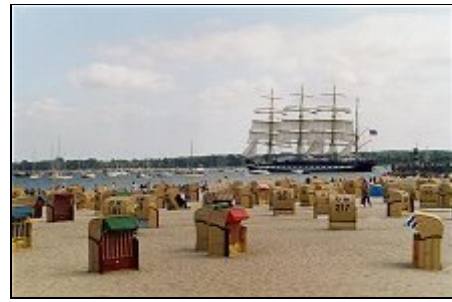
Am Strand Blick auf Traditionssegler

Seebad Travemünde, schönste Tochter der histor. Hansestadt Lübeck. Fähr- und Fischereihafen an der Mündung der Trave in die Ostsee mit einer geschlossenen Altstadt und Austragungsort internat. Segelregatten. Spazieren Sie über die Travepromenade. Haushohe Fähren ziehen zum Anfassen nahe an Ihnen vorbei. Die Lübecker Bucht mit seiner abwechslungsreichen Küstenlandschaft und seinen Naturschutzgebieten sowie Kultur und Geschichte dieser Region machen aus Travemünde ein vielseitiges Urlaubsziel.