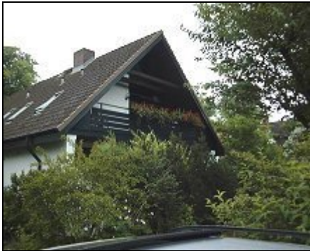
Blick aufs Haus mit Loggia

Unsere sonnige 3 Zimmer Wohnung liegt in der Probstei, umgeben von Ostsee Badestränden (6 Km) und ist mit dem ZUG, Auto, Bus oder Fahrrad zu erreichen