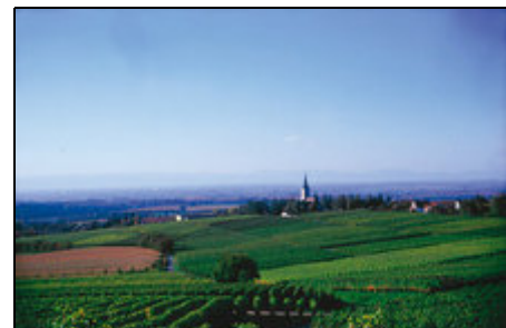
Blick vom Castellberg in die Rheinebene

Eingebettet zwischen den idyllischen Rebhängen von Castellberg und Fohrenberg liegt das beschauliche Winzerdorf Ballrechten-Dottingen in einer Höhenlage zwischen 220 und 405 Metern. Dieses herrliche Fleckchen Erde mitten im Bäderdreieck Badenweiler, Bad Krozingen und Bad Bellingen bietet ein ideales Umfeld für einen erlebnisreichen Urlaub. Lassen Sie sich verwöhnen von der einladenden Gastlichkeit und der vorzüglichen Gastronomie der Winzerdörfer an der badischen Weinstraße.