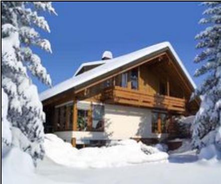
Unser Haus im Winter

FeWo im Holzdesignhaus am Sonnenhang von Dottingen, nahe Staufen an der südl. Weinstraße, Südschwarzwald. Busse & Bahnen in der Regio inklusive.