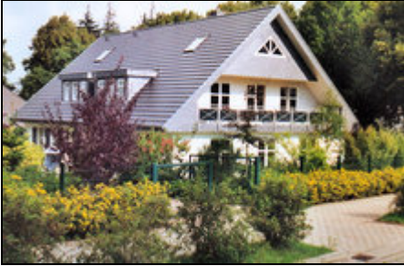
Südansicht, 85 qm Wohnung, 1. Etage