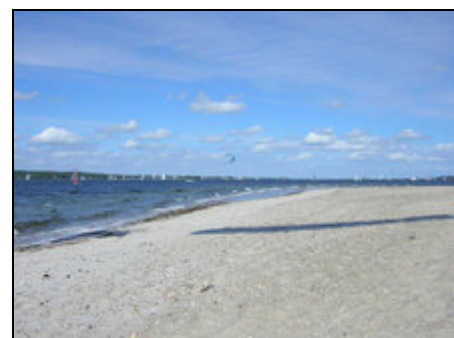
Strand in der Nähe (Fahrensodde)

Ortsrand von Flensburg, 5 km bis zum Kurort Glücksburg, Ostseestrandbad in 5 Fußminuten, Wald direkt vor der Tür. Ruhige und exklusive Wohnlage. Zur Innenstadt Flensburg und zum Hafen 4 km. Sehr gute Restaurants in unmittelbarer Umgebung. Gute Einkaufsmöglichkeiten in der Nähe.