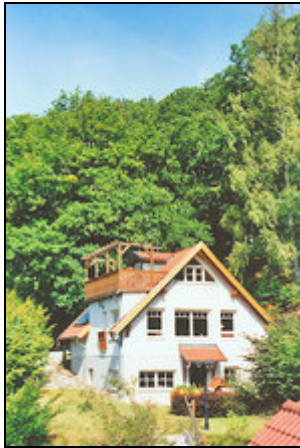
FH mit 2 Ferienwhg.n, Gartenseite

Ferienhaus mit 2 unabhängigen Ferienwohnungen. Südhanglage über dem idyllischen Bodetal. N u r N i c h t r a u c h e r !