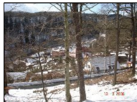
FH rechts, dahinter Dorf und Bodetal

Ostharz, wildromantisches Bodetal. Im Ort: Wellness, Restaurants, Cafes, Waldfreibad, Wald-Freilichtbühne m. Musik- und Theateraufführungen. Tagesausflüge: Rappbodetalsperre, Harzer Schmalspurbahn, Thale mit Seilbahnen zur Roßtrappe und Hexentanzplatz, dort Freilichtbühne u. Tierpark. Blankenburg mit Schlössern und Barockgarten u. "Teufelsmauer" (Felsformation / Geologische Berühmtheit). Wanderung auf den Brocken. Quedlinburg (Weltkulturerbe Altstadt und Dom), Wernigerode (Altstadt und Schloß).