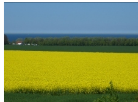
weite Landschaften, super Sonnenuntergang

Von hier aus erreichen Sie das Ostseebad Heiligendamm (G8), das maritime Warnemünde oder Rostock, mit der jedes Jahr stattfindenden Hanse Sail. Spazieren, Wandern, Reiten oder mit dem Fahrrad. Hier finden sie wirklich ideale Bedingungen, um sich zu erholen. Mit 200 Veranstaltungen wartet Kühlungsborn im Sommer auf. Am feinen Sandstrand finden Sie Tauch/Surfschulen, Bootsverleihe etc. Vom neuen Yachthafen aus können Sie in See stechen, oder einfach nur das maritime Flair in einem kleinen Lokal genießen.