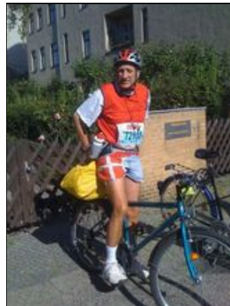
Verkehrstechnisch optimal angebunden

Ferienwohnung liegt im gepflegten, grünen Stadtteil Neu-Westend (Charlbg.) Einkaufsmöglichkeiten, Cafe, Restaurants. Ist einfach und schnell erreichbar über Autobahn, Flughafen Tegel oder Bahnhof Zoo (Bus M45 fährt von Bhf. Zoo 15 Min. fast vor die Tür). In der Nähe befinden sich: Messegelände, Funkturm, ICC, rbb, Waldbühne, Olympiastadion . In 5 Min. sind Sie auf der Messe (Pkw, Bus, Fahrrad), in 15 Min. erreichen Sie mit Bus U-oder S-Bahn City West/Ost mit Brandenburger Tor, Reichstag