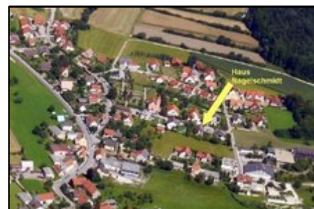
Luftbild, östlicher Teil von Schwend

Schwend Gemeinde Birgland liegt im Sulzbacher Bergland in erholsamer Lage bis 659 m ü.NN. Drei Freibäder, das Erlebnisbad in Amberg und die Frankenalb Therme in Hersbruck mit 80-Meter-Rutsche finden Sie in der Umgebung. Regensburg, Altdorf, die Fränkische Schweiz mit ihren Tropfsteinhöhlen, das Altmühltal, der Stausee Happurg und der Playmobil-Funpark in Zirndorf liegen fast vor der Haustür. Aussteller und Besucher der Spielwarenmesse in Nuernberg erreichen diese in 25 Minuten über die Autobahn.