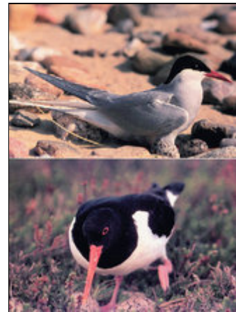
Seeschwalbe und Austernfischer mi Eiern

Alter Ortskern von Norddorf mit Friesenhäusern und mit Meerblick. Für Vogelbeobachter und Ornithologen ist Amrum besonders interessant im April, Mai, August, September und Oktober. Näheres im Internet unter Birdinggermany / Amrum und Nationalpark Schleswig-Holsteinisches Wattenmeer.