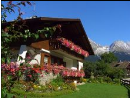
Haus Auerbrunn im Sommer

Urlaub in Südtirol! Wandern, Bergsteigen, Biken, Fischen... sowie Ruhe & Erholung finden im schönen Antholzertal!