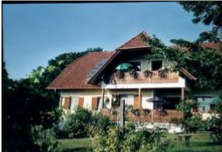
Haus und Garten

In der Oststeiermark, umgeben von Obst- und Weingärten liegt in ruhiger Lage unser Haus mit unserer komfortabel eingerichteten Ferienwohnung.