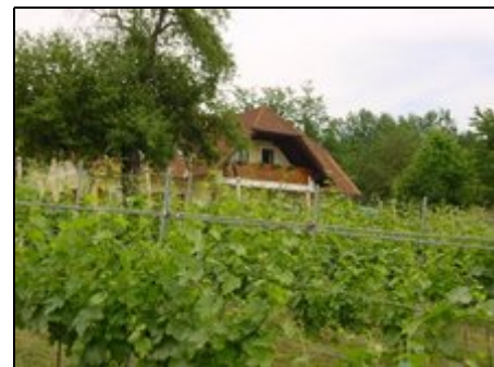
Blick über die Weinberge

Hügel, soweit das Auge reicht, ein beinahe mediterranes Klima, fruchtbare Böden, romantische Burgen und Schlösser sind die Anziehungspunkte unserer Landschaft. Zahlreiche Ausflugsmöglichkeiten (Kulturhauptstadt Graz, Apfel- und Römerweinstraße, Riegersburg, Tierpark und Schloss Herberstein usw.), nahegelegene Thermen und viele Sportmöglichkeiten (Radfahren, Wandern, Schwimmen, Tennis, Paragleiten usw.) lassen keine Urlaubswünsche mehr offen.