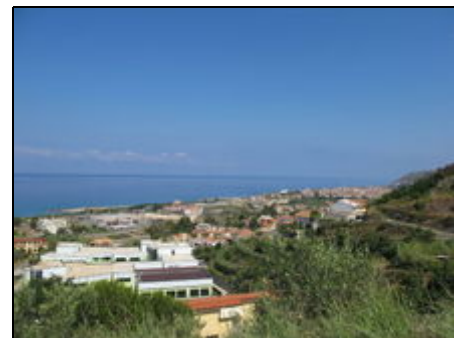
Blick auf Amantea

Die Strände unterhalb der Casa del Vallone bestehen aus Sand, tlw. mit Kiesstreifen und Felsen. Das Meer und die Strände sind sauber, frei zugänglich, mit Parkmöglichkeiten. Amantea (4 km) hat eine romantische Altstadt mit Festungsrüinen und einen gemütlichen neuen Ortskern. Das bergige Hinterland ist typisch kalabresisch: Kastanienwälder, uralte Olivenhaine, bizarre Felsen, historische Orte.