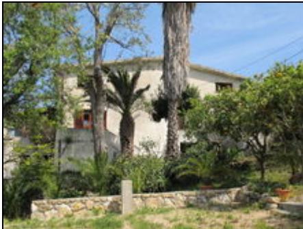
Casa del Vallone