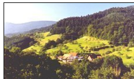
Blick auf den Langenhof

Viele Wander- und Ausflugsmöglichkeiten z.B. Klosterruine Allerheiligen mit Wasserfällen, Europapark, Straßburg, Freudenstadt, Baden-Baden, Mummelsee, Vogtsbauernhof, Glasbläserei, Gleitschirmfliegen, Sommerrodelbahnen und vieles mehr.