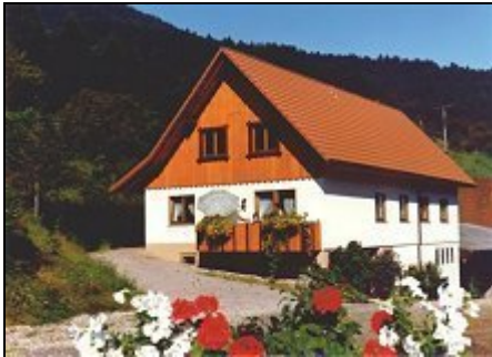
Ferienhaus mit 3 Fewo

Hauptberuflicher Schwarzwälder Bauernhof in schöner Tallage. Mit drei Landhaus Ferienwohnungen im separaten Nebenhaus zwei Wohnungen sind ebenerdig.