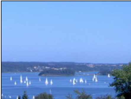
Blick auf die dänischen Ochseninseln