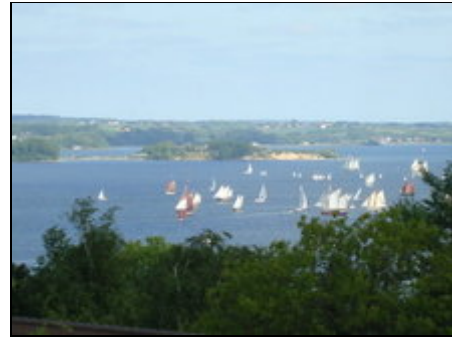
Blick auf eine Segel-Regatta 2010

Die Wohnanlage liegt in einer parkähnlich angelegten Grünanlage in unmittelbarer Nähe der Flensburger Förde. Mit sehr schönen Wanderwegen, teilweise direkt am Wasser. Sehr gute Einkaufsmöglichkeiten (z.B. Aldi ca. 5 Min. Fußweg) Nähe Marineschule. Schöne Badestrände in der Nähe: Solitüde (zu Fuß erreichbar in ca. 25 Min.), Glücksburg/Holnis m.d. Pkw in ca. 10-20 Min. Sehr gute Busverbindungen vom Twedter Plack, (5 Min. Fußweg) zum Zentrum, Förde-Park, Glücksburg, Schloß, Fördeland Therme Gbg. usw..