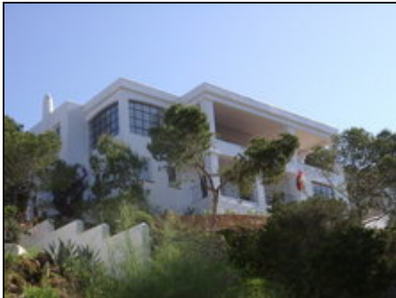
Ansicht Haus hinten

Ruhig gelegene Ferienwohnung mit traumhaftem Blick von Wohnraum, Schlafzimmer und Terrasse auf das Meer und die sanfte Hügellandschaft Ibizas.