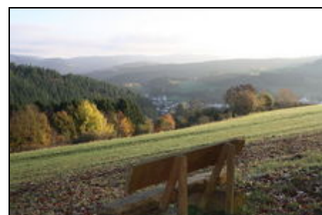
Genießen Sie unsere schöne Eifel