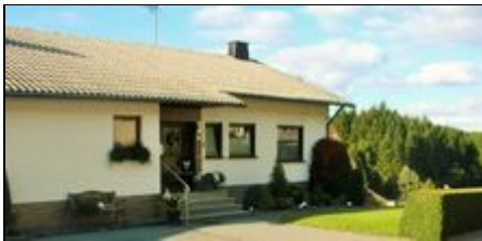
Ferienwohnung Waltraud Tibo

Neue und sehr gemütliche Ferienwohnung Nähe Nürburgring mit eigenem Eingang und Terrasse. Garage für Motorräder ,PKW Stellplätze direkt am Haus.