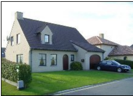
Aussenansicht Vorderseite vom Ferienhaus

Excl. Ferienwohnung in Villen-Neubaugebiet am Meer. Die FeWo liegt auf der 1. Etage in freistehendem 2-Familienhaus i.ruhiger Lage. Internetzugang