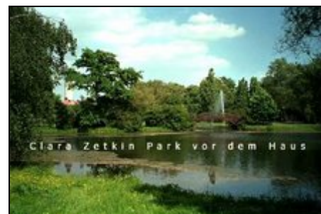
Clara Zetkin bzw. Johanna Park.

Bushaltestelle aus Rchtg. Hbf. in Rchtg. Connewitzer Kreuz unmittelbar am Haus. Viel Gastronomie in unmittelbarer Nähe. Der Park zum relaxen, schauen od. Inline Skaten u. Fahrrad fahren vor der Tür. Unseren Gästen werden auf Wunsch 2 Fahrräder zur Verfügung gestellt. Wir bieten einen Kühlschrankservice, Abholservice v. Bhf. od. Flughafen und stehen mit vielen Tipps und für Fragen jederzeit zur Verfügung.