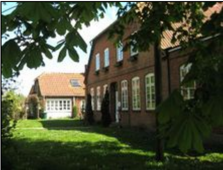
FeWo SEEADLER Gutshof Heringsdorf

Geräumige, modern eingerichtete FeWo für 1-4 Gäste mit. eig. Garten, Ostsee-Nähe (4,5 km, kostenfrei), sep.Flügel eines ex-Gutshofs (7000 m²)Ostholst.