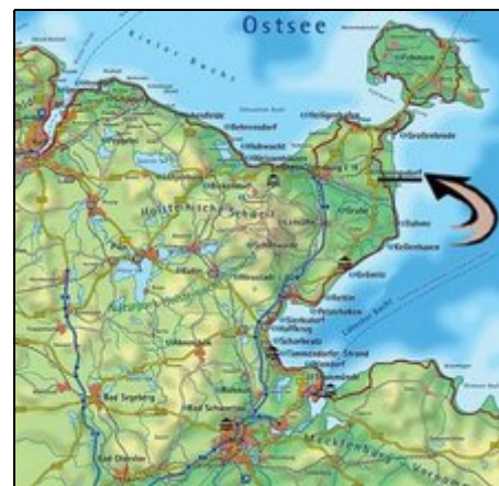
Heringsdorf Ostholstein -an der "Spitze"

Heringsdorf (Ostholstein, 1.020 Einwohner) liegt 4,5 km von feinen Bade-Sandstränden entfernt (Textil, FKK), teils Natur-/Steilstrand, Hundestrände. Im Dreieck Grömitz - Großenbrode(vor Fehmarn)-Heiligenhafen. Das Fahrradwegenetz ist top ausgebaut und beschildert. KEINE Kurtaxe, KEINE Strandgebühren. Ferienhof ohne Landwirtschaft; einige 'Streicheltiere'. Arzt, 'Tante Emma' (u. a. Brötchen) u. Getränke im Dorf, sonst beste Einkaufsmöglichkeiten in Oldenburg/Holst. (7 km) und Heiligenhafen (9).