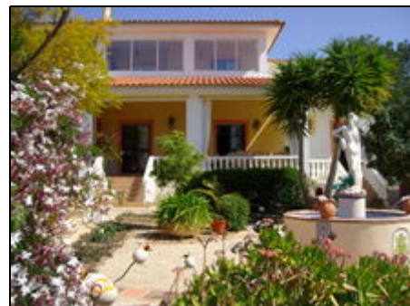
Hau und Garten

Unser Haus ist 2 Km ausserhalb von Armacao de Pera ruhig, und doch sehr zentral gelegen. Zu den Traumhaften Fels und Sandstränden sind es nur 2, nach Albufeira, dem lebhaftesten Ort der Algarve 11, nach Faro 45 und nach Portimao 18Km. Die Westküste und das Monchice Gebirge sind schnell erreicht und viele Einkaufsmöglichkeiten liegen in unmittelbarer Nähe. Unser Grundstück mit schönem Garten und gemütlichem Grillplatz unter schattenspendenden Johanniskrautbäumen lädt zum Verweilen und geniessen.