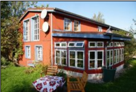
Ferien im Grünen auf 2 Etagen

Die Ferienwohnung wird z.Zt. umgebaut und eventuell auch länger vermietet, unser Häuschen steht als Alternative zur Verfügung , siehe dort