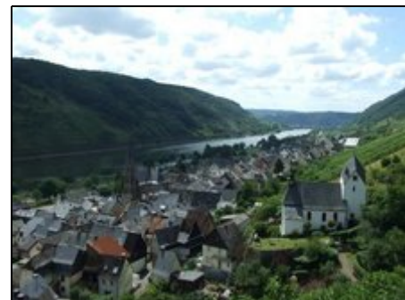
Blick auf St. Aldegund mit alter Kirche

Neben Cochem und Zell sind Trier, Luxemburg, oder Koblenz einen Ausflug wert.