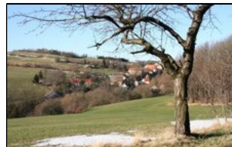
Blick zum Hof

An warmen Tagen steht ein wunderschöner Pool zur Verfügung. Sie können gemütlich im Garten relaxen und den herrlichen weiten Blick bis zu den Gipfeln der Sächsischen Schweiz genießen. Deutlich erkennt man z.B. Lilienstein und Königstein, zwei sehr bekannte Gipfel der Sächsischen Schweiz. Das reizvolle Bergdorf Maxen ist ca. 10 km von Dresden entfernt und befindet sich in der wunderschönen Hügellandschaft im Vorfeld des Osterzgebirges und vor der bizarren Sandsteinkulisse der Sächsischen Schweiz.