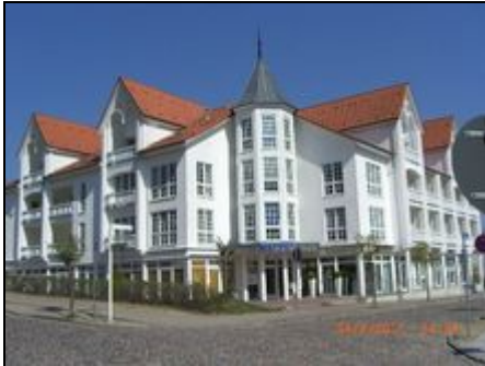
Sellin, Haus Baltic

Ferienwohnung 29 im Haus Baltic für 2-3 Personen, helle, freundliche 1-Zimmer-Wohnung mit raumhohen Sprossenfenstern, überdachter Balkon nach West