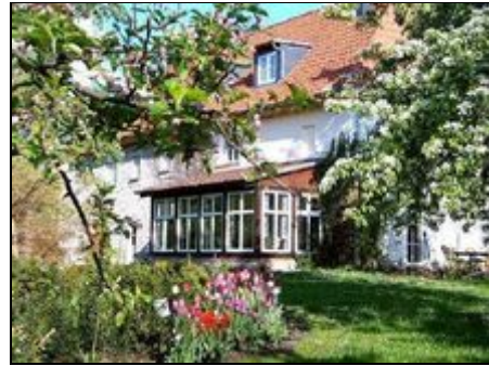
Frühling in der Geistmühle

Halberstadt liegt am Rand des Harzes, an der Straße der Romanik. Hier sind der berühmte Dom mit Domschatz und viele mittelalterliche Kirchen und Klöster zu besichtigen. Zu den bekannten Städten Quedlinburg (Unesco Weltkulturerbe) + Wernigerode (Rathaus, Schloss, Fachwerk) sind es nur ca. 20km. Auch in den Oberharz (z.B. Wandern, Wintersport, Bergtheater Thale, Hexentanzplatz, Brocken-Schierke) fährt man nur ca. 30min. Die Motorsport Arena Oschersleben liegt nur ca. 16 km entfernt.