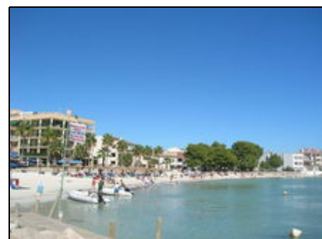
Strand am Hafen von Colonia Sant Jordi

Colonia Sant Jordi liegt in der südlichsten Spitze von Mallorca und ist der perfekte Urlaubsort für Familien mit Kindern. Von hier aus haben Sie einen traumhaften Blick auf die Insel Cabrera, die Sie unbedingt besuchen sollten. Cabrera steht unter Naturschutz. Es gibt eine schöne organisierte Tagestour. Zum Es Trenc Strand ist es nur einen Katzensprung. Kennen Sie schon Ses Salines mit seinen tollen Restaurants? Haben Sie schon mal Salzberge gesehen? Der ideale Ort für einen Familienurlaub.