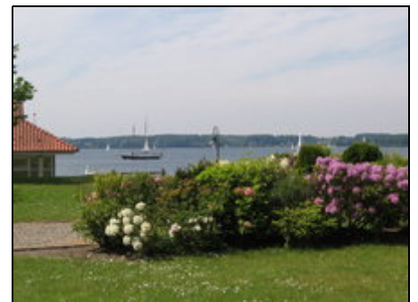
Blick auf die Förde und Dänemark

Herrliche Wälder, Seen und die Flensburger Förde laden zu langen Spaziergängen ein. Golf- oder Tennisfreunde können hier genauso ihrer Leidenschaft nachgehen wie Segler. Golfplätze in Dänemark und Deutschland und z. B. eine Tennisanlage, sehr schön im Wald gelegen, laden zum abschlagen oder aufschlagen ein. Der Yachthafen und die Hanseatische Yachtschule sind schnell fußläufig erreichbar. Auch für das leibliche Wohl ist gesorgt. Es gibt viele Möglichkeiten, in nächster Nähe sehr gut zu speisen.