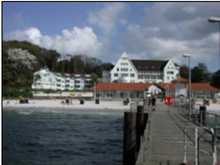
Villa Mare & Strandhotel

Eine der schönsten Ferienwohnungen in Glücksburg- Sandwig ganz nah am Strand und mit wunderschönem Blick auf die Flensburger Förde und nach Dänemark.