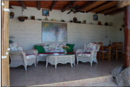
Gedeckte Terrasse, das 2. Wohnzimmer

Die Finca La Puerta de Alcalá ist eine private Finca im Süd - Westen von Teneriffa, traumhafte Lage über dem typisch kanarischen Fischerdorf Alcalá.