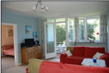
Wohnzimmer mit Blick auf Balkon

Liebevoll und gemütlich eingerichtete Ferienwohnung zum Wohlfühlen nach dem Motto: "Unterwegs zu Hause" Ideal für Kurzreisen, Sommerurlaub, Wochenende